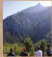
RUTA GUIADA Los paisajes y contrastes de la umbria de España Sábado 12 de febrero