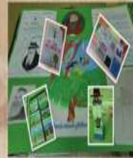
EXPOSICIÓN 12 árboles y una emoción Todo el mes de febrero y marzo