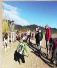
RUTA GUIADA En busca de los animales Domingo 30 de enero