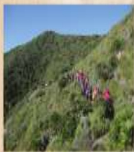
RUTA GUIADA Historia de un paisaje Sábado 19 de febrero