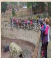
ACTIVIDAD ESPECIAL Día Mundial de la Vida Silvestre Sábado 5 de marzo