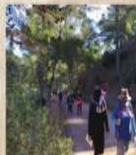
RUTA GUIADA La vida en el bosque del Monte de las Cenizas Sábado 12 de marzo