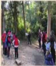
ACTIVIDAD ESPECIAL Cuentacuentos forestal Sábado 22 de enero

Me ha gustado mucho sentir toda el ir sin prisas y viviendo el momento.