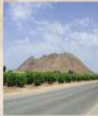
RUTA GUIADA ¿Conoces el Cabezo Gordo? Domingo 23 de enero y domingo 20 de marzo