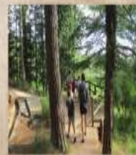
RUTA GUIADA La sabiduría del bosque Domingo 27 de marzo